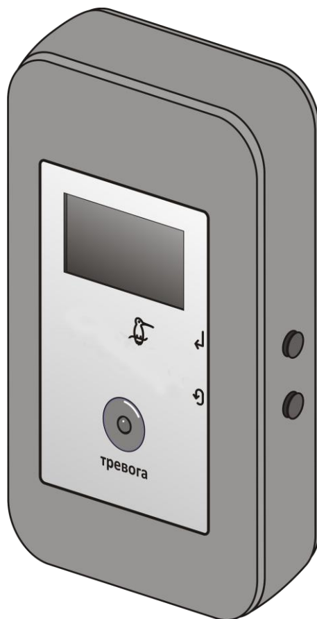
Мобильная тревожная кнопка «Гаруда»

Дополнительные сведения об изделии Вы можете получить на сайте www.telemak.ru .